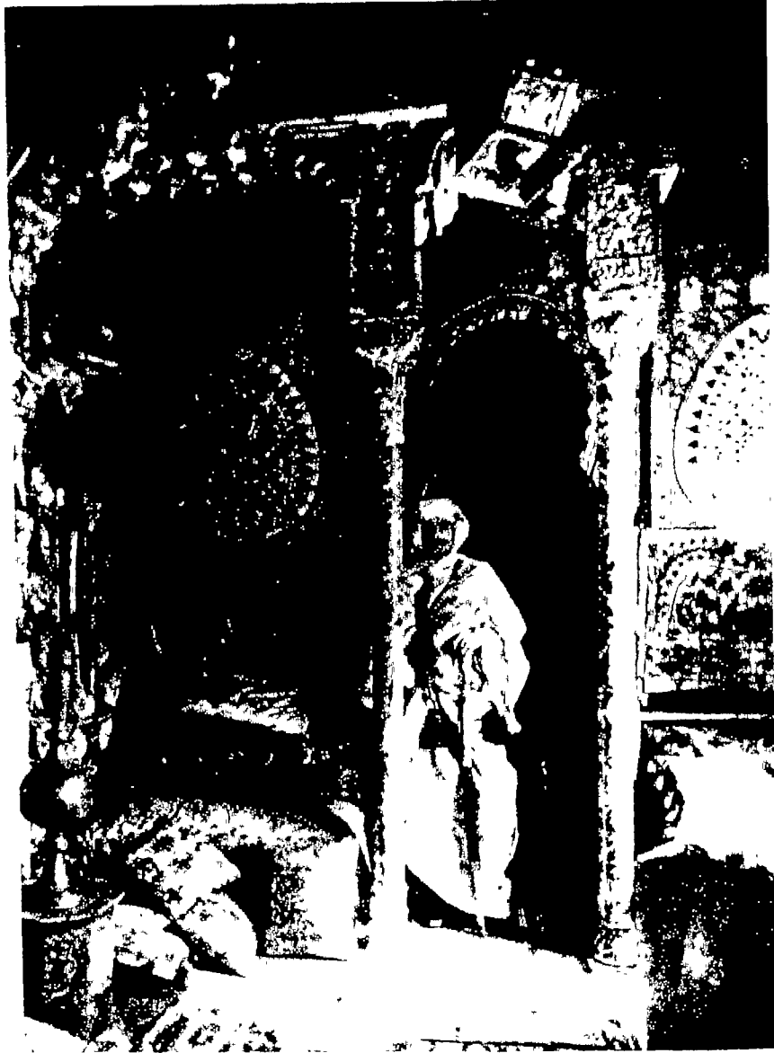
مسكن بئر لوتي حيث تظهر بعض المؤثرات الشرقية